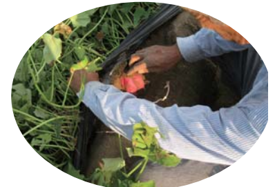
作物の状態、土の状態のチェックは毎日欠がせません。いつも最高の状態でないとはいけません。

ハローランチいけちゃん いけちゃん農園 オリジナル幼稚園給食に 関するお知らせ新聞です。