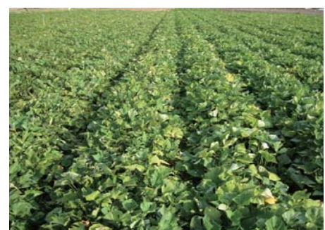
元気な工場は役割を果たすと黄色く焼けてきて、完熟しかけているのがわかります。

「微量元素、特に苦土(マグネシウム)が「うまい野菜」には必要です。」 土壌中には色々な微量元素が含まれています。この微量元素を野菜は水と一緒に体内に取り込みます。必要な微量元素が十分に取れなかったら野菜は健全に育ちません。マグネシウムは葉緑素として植物の光合成をする役目を果たしています。光合成が十分に進めば野菜の中にでんぷんや糖分が十分に蓄積され糖度の高いあまい野菜が作ることができるというものです。