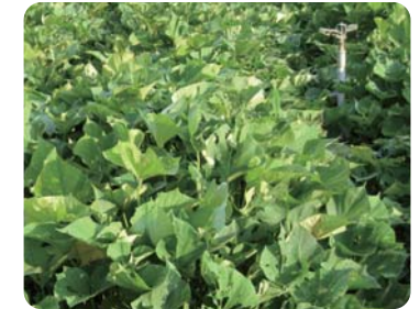
灌水は香川用水をスプリンクラーで行います。元気な葉っぱはゴワゴワしていて厚手の古紙のようでした。

「微量元素、特に苦土(マグネシウム)が「うまい野菜」には必要です。」 土壌中には色々な微量元素が含まれています。この微量元素を野菜は水と一緒に体内に取り込みます。必要な微量元素が十分に取れなかったら野菜は健全に育ちません。マグネシウムは葉緑素として植物の光合成をする役目を果たしています。光合成が十分に進めば野菜の中にでんぷんや糖分が十分に蓄積され糖度の高いあまい野菜が作ることができるというものです。