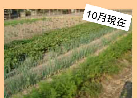
こんなに育ちましたぁ