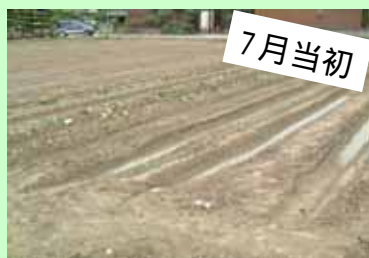
チビチビと緑があっただけの畑です。