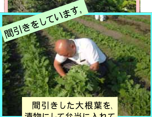
間引きした大根葉を、 漬物にして弁当に入れて みました。 お味はいかがでした でしょうか・・・?

ねぎ 人参 大根 さつまいも ミニトマト 白菜 などなど、たくさん挑戦して いるところです。